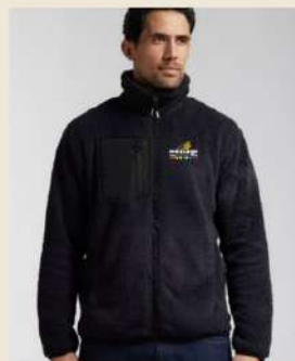
Bodywarmer ML en sherpa Broderie cœur à partir de 32,53€ H.T