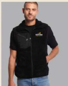
Bodywarmer MC en sherpa Broderie cœur à partir de 27,35€ H.T