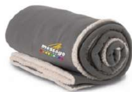
Plaid en sherpa Broderie de votre logo à partir de 25,07€ H.T