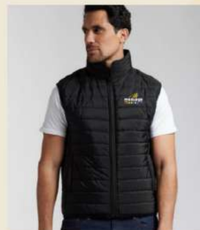
Bodywarmer intérieur en sherpa Broderie cœur à partir de 26,92€ H.T